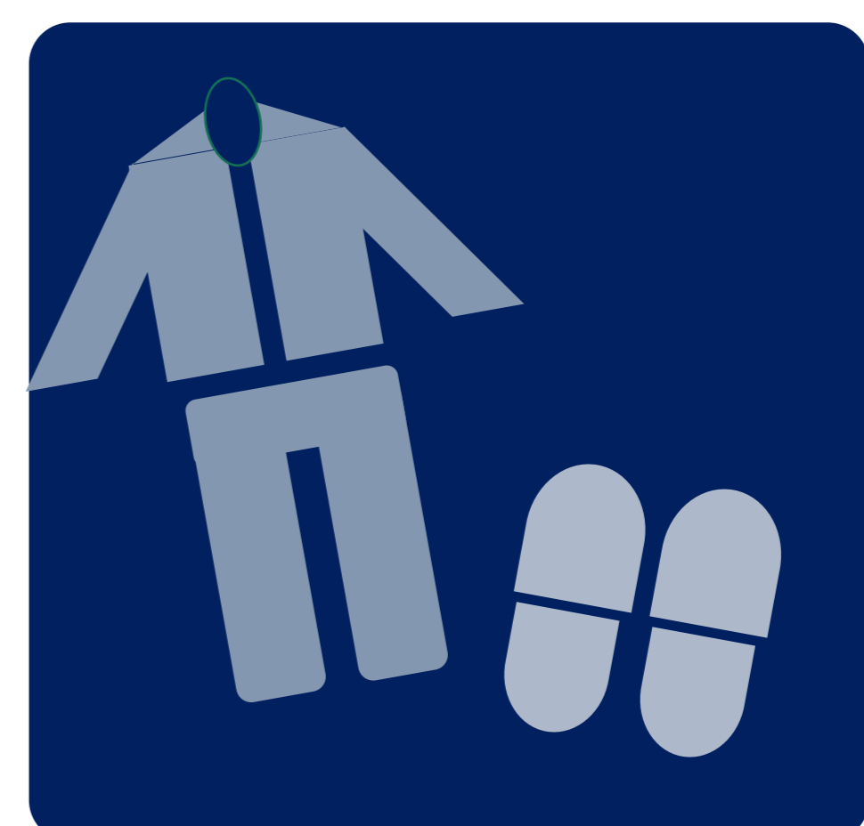
部屋着、スリッパは 客室のみで Pajamas and slippers ONLY in your room