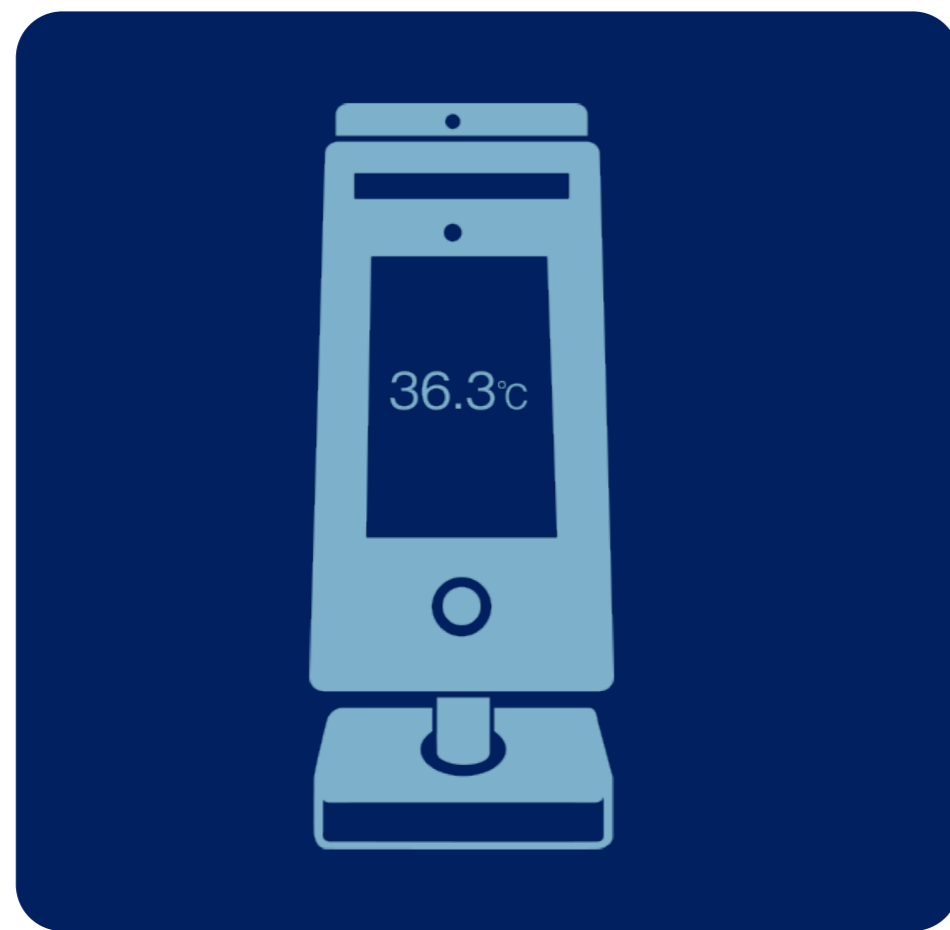
入館時の検温 Temperature Measurement