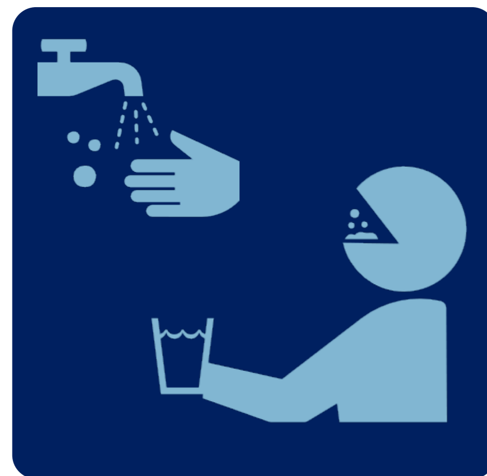
手洗い・うがいの徹底 Wash Your hands/Gargle

※マスクをお持ちで無いお客様へは ホテルよりご提供いたします。お申し出ください。 * If you don't have a mask, we will provide it to you. Please contact the front desk.