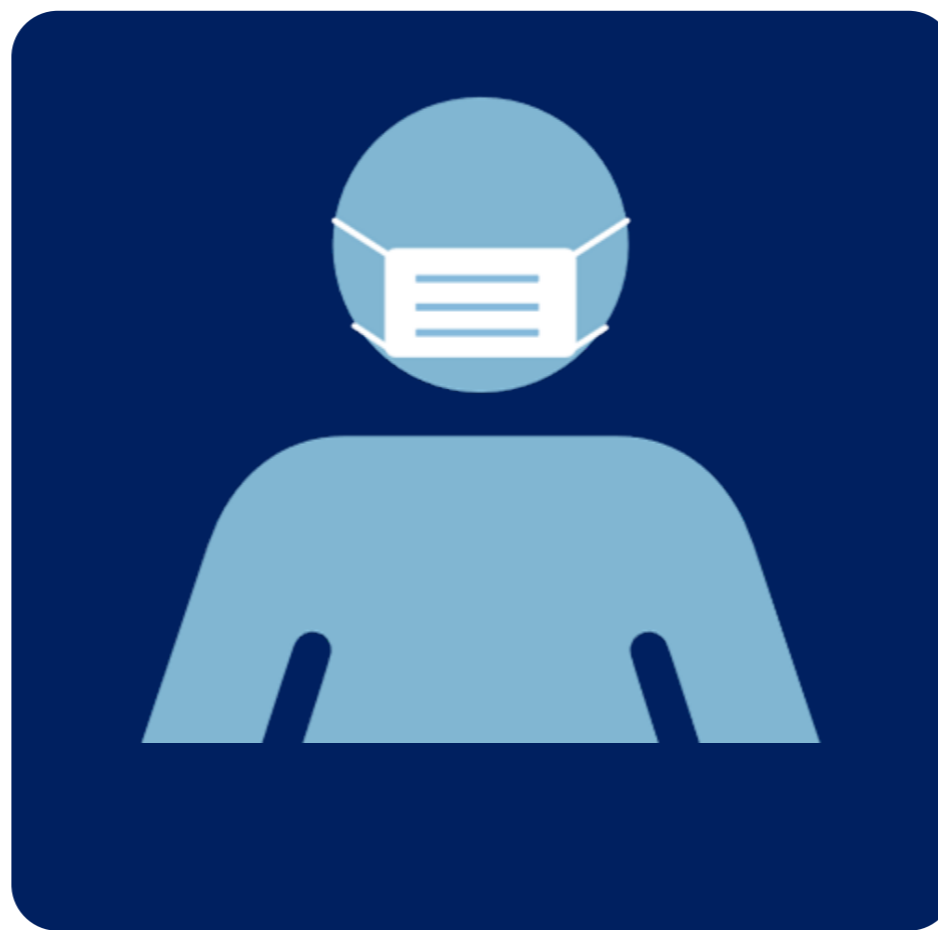
館内で常時マスク着用 Wear Masks