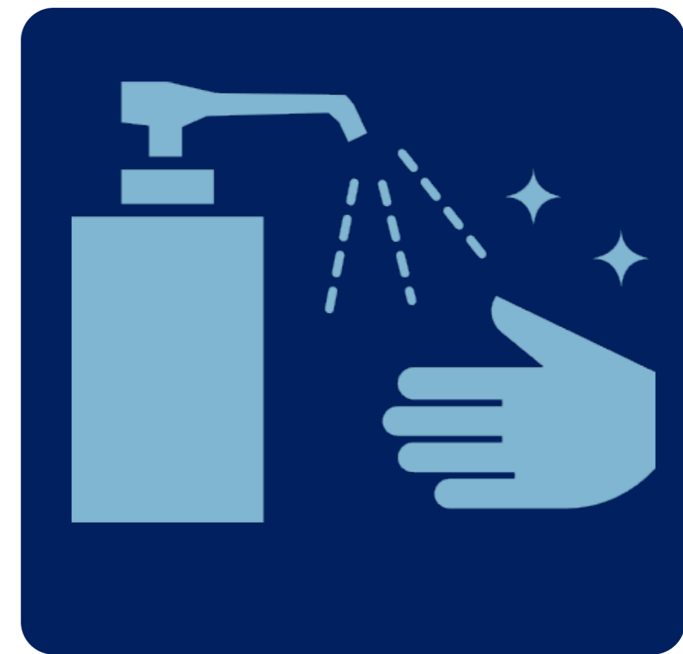
入館時はアルコール消毒 Sanitize Your Hands

※マスクをお持ちで無いお客様へは ホテルよりご提供いたします。お申し出ください。 * If you don't have a mask, we will provide it to you. Please contact the front desk.